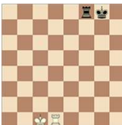
Avant le grand roque blanc Après le grand roque blanc Avant le petit roque noir Après le petit roque noir