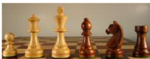
P D R F C T

2.3 La position initiale des pièces sur l'échiquier est la suivante :