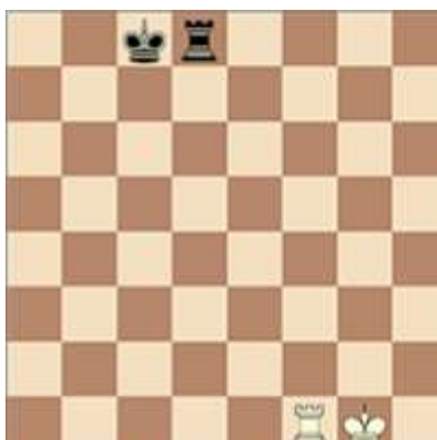
Avant le petit roque blanc Après le petit roque blanc Avant le grand roque noir Après le grand roque noir